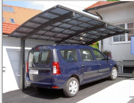
Portoforte 170 (DCP170)