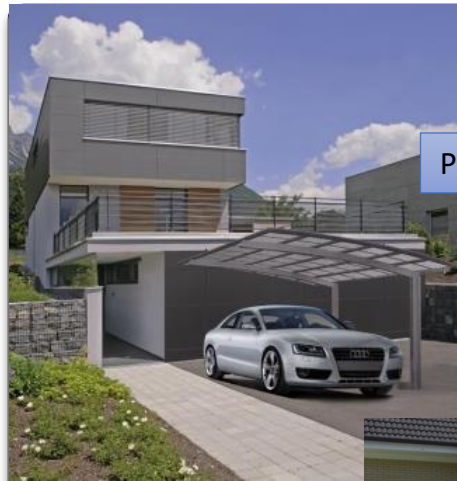
Portoforte 110 (DCP110)